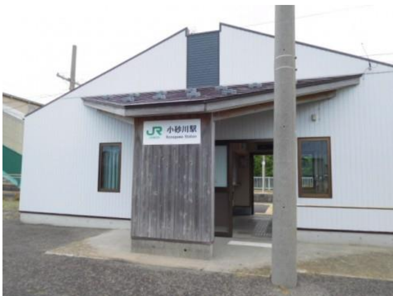
営業キロ1万1千キロ到達 の小砂川駅