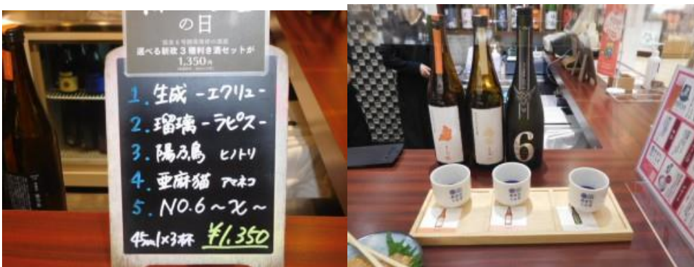
※立ち飲み酒場で新政を賞味！！

③18時40分の電車で秋田駅まで移動。駅構内の立ち飲み酒場で、飲み比べ新政（陽乃鳥、亜麻猫、NO.6X-type）を楽しみ、本日は閉幕となる。