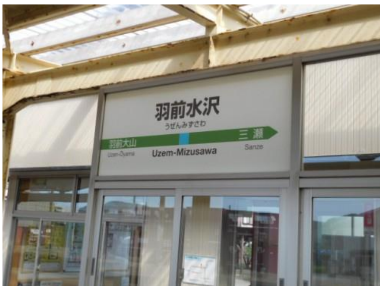
4割突破した羽前水沢

今回の歩きで通算営業キロは1万1千103 km (活動日数 544 日) となった。同時に、7月3日(金)は”日本の鉄道の4割突破する記念日”となった。突破時刻と駅舎は15時23分、羽前水沢駅(羽越本線)で。この日は運よく終日晴れで、あつみ温泉界隈の海岸線の眺めは最高であった。また、6月30日(火)、秋田県と山形県の県境にある小砂川駅(こさがわ、秋田県、羽越本線)で1万1千キロを達成した。