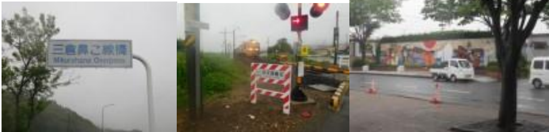
※三倉鼻跨線橋、夜叉袋踏切、八郎潟駅