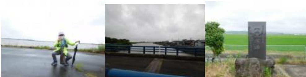
八郎潟、井川さくら駅への路