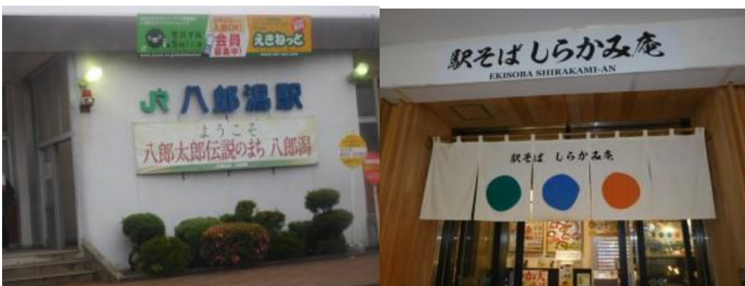
※八郎潟駅、夕食の蕎麦屋

③18時40分の電車で秋田駅まで移動。駅構内の立ち飲み酒場で、飲み比べ新政（陽乃鳥、亜麻猫、NO.6X-type）を楽しみ、本日は閉幕となる。