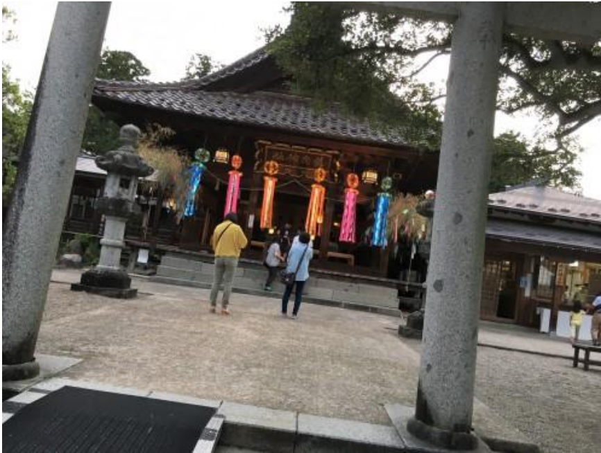
※鶴岡公園内にある荘内神社