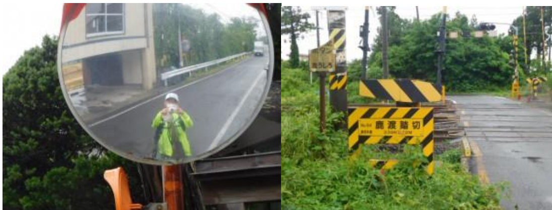
※鹿渡駅への路、鹿渡踏切

17時31分、夜叉袋踏切を横切り、鉄道の右側に出て、線路に沿って歩いた先に本日の終着駅の八郎潟駅（18時）があった。